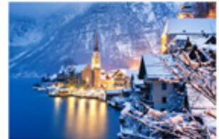
Reisen und Urlaub