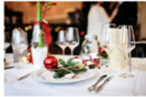
Gastronomie und Hotels