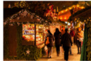
Ausflugs- und Veranstaltungstipps